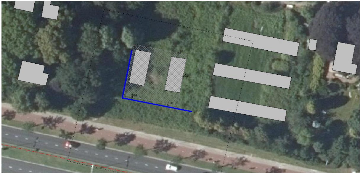
Figuur 1. Ligging scherm met landelijke voorziening beeldmateriaal