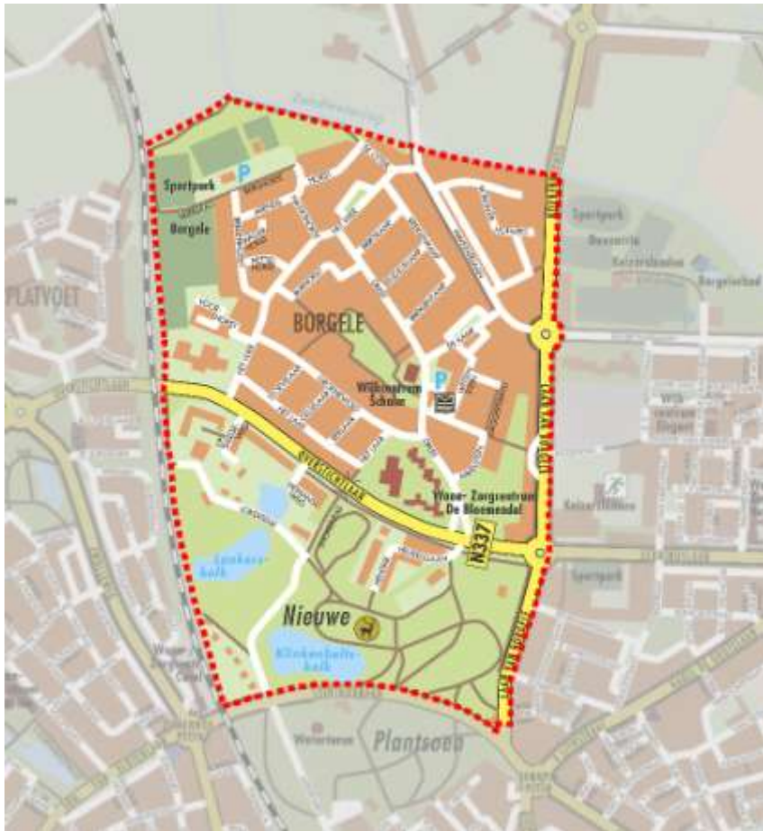
Begrenzing plangebied "Borgele"