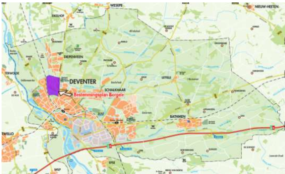
Globale ligging plangebied "Borgele"