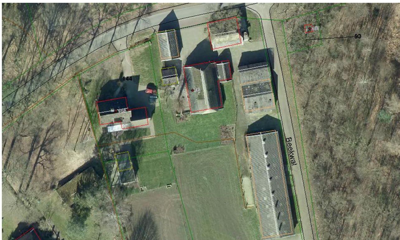
Luchtfoto Bronsvoorderdijk 14A - 16

Het erf wordt gevormd door de percelen van de Bronsvoorderdijk 14A en 16 aan de Bronsvoorderdijk. Op het erf zijn twee woningen gelegen en vijf panden die dienden voor de oude agrarische functie. Het erf is voor het grootste gedeelte onverhard.