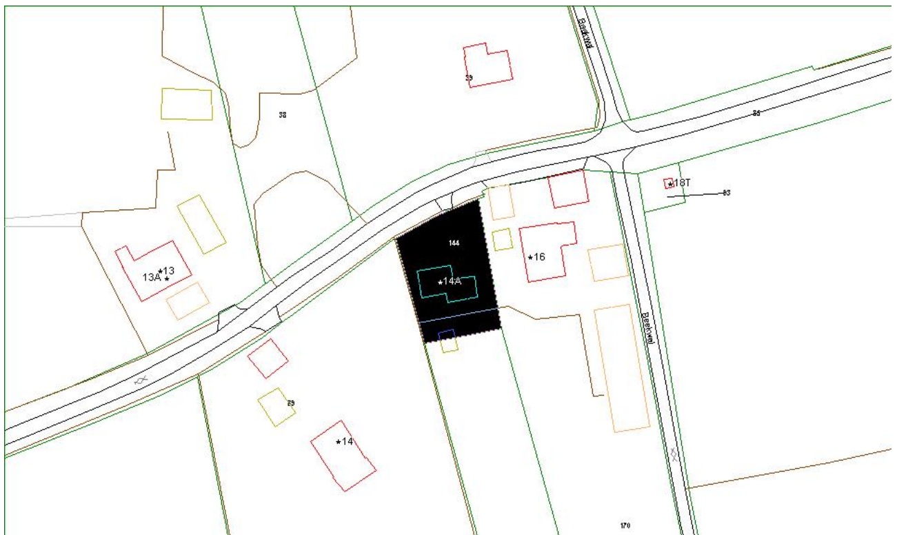
Ligging kadastraal perceel, Bronsvoorderdijk 14A

Het perceel van woning 14 A is kadastraal bekend gemeente Deventer, sectie H, nummer 00144.