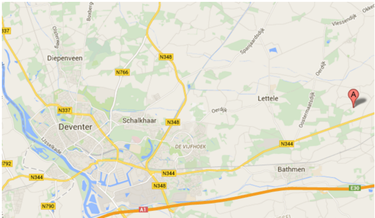
Globale ligging plangebied "Ikkinksweg 4"

De Ikkinksweg 4 ligt in het buitengebied van Lettele in de gemeente Deventer. In onderstaande figuur is de ligging globaal weergegeven.