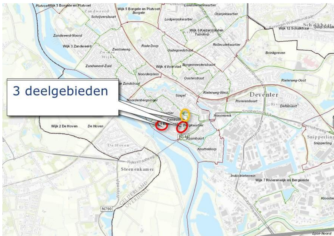
Figuur 1. Globale ligging plangebied "Binnenstad, herziening Kop van de Brink, wijziging horecaquota"