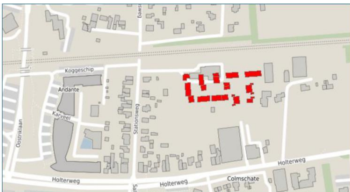
Afbeelding 1: overzicht bouwplan Stationsweg Colmschate

In het kader van dit ontwerp bestemmingsplan is een akoestisch onderzoek uitgevoerd. Uit het akoestisch onderzoek (Royal HaskoningDHV, 28 januari 2022) blijkt dat de hoogst optredende geluidsbelasting op de gevels van de nieuwe woningen vanwege railverkeer 67 dB bedraagt en daarmee de voorkeurgrenswaarde van 55 dB overschrijdt. Omdat maatregelen gericht op het terugdringen van de geluidsbelastingen niet toereikend zijn, dient op grond van de Wet geluidhinder een hogere grenswaarde te worden verleend.