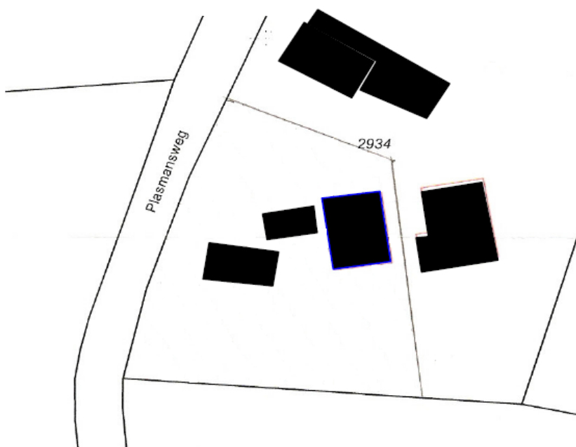
Bebouwing bestaande situatie