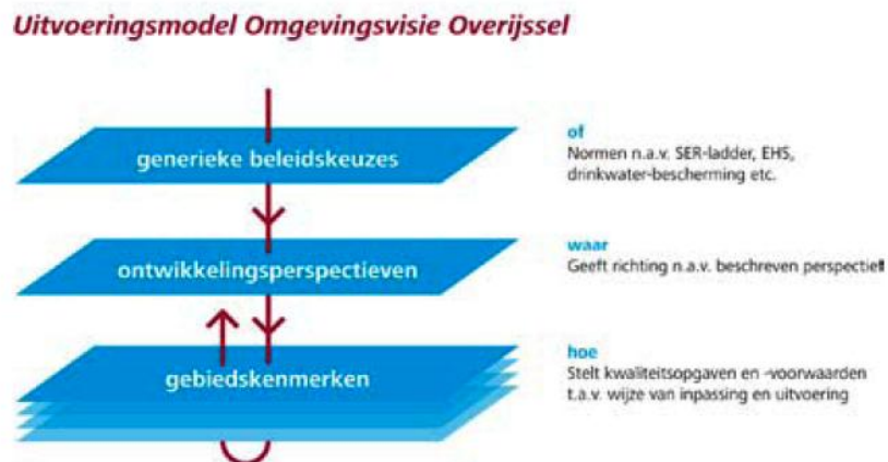
Uitvoeringsmodel Omgevingsvisie provincie Overijssel

De Omgevingsvisie is in juli 2009 vastgesteld als structuurvisie onder de Wet ruimtelijke ordening. Het betreft het integrale, provinciale beleidsplan voor de fysieke leefomgeving van Overijssel. De rode draden van de Omgevingsvisie zijn ruimtelijke kwaliteit en duurzaamheid. Om de provinciale ambities te bereiken wordt gebruik gemaakt van het uitvoeringsmodel. Deze is weergegeven in onderstaande figuur.