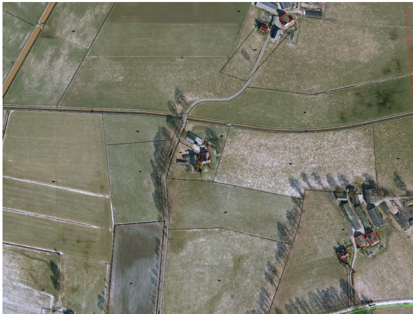
Luchtfoto bestaande situatie

Het perceel ligt in een weteringenlandschap. Dit landschap heeft een half-open karakter. Door houtwallen en doorgaande laanbeplantingen ontstaan kleine en grotere groene kamers. De Plasmansweg zelf heeft een deels doorgaande laanbeplanting. De erven in de directe omgeving liggen op relatief grote afstand van elkaar (minimaal 70 m). Het perceel ligt daardoor in een grote open ruimte. Het perceel grenst aan de noordzijde aan de Soestwetering. Hieronder is een luchtfoto van het perceel aan de Plasmansweg 2 weergegeven.