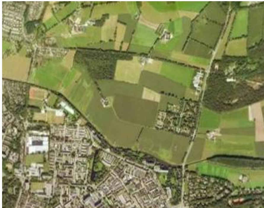
Luchtfoto ligging plangebied