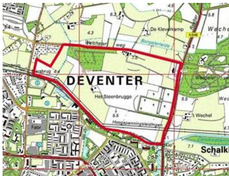
Ligging van het plangebied

De planopzet betreft een globaal bestemmingsplan met een uitwerkingsplicht ex artikel 3.6 lid b van de Wet ruimtelijke ordening (Wro). Het gebied heeft grotendeels een nader uit te werken bestemming ten behoeve van de realisatie van een omvangrijke woonwijk. Om per fase in te kunnen spelen op de behoefte van de markt is voor deze uit te werken bestemming gekozen. Bestaande maatschappelijke voorzieningen, natuur en water binnen het plangebied wordt direct positief bestemd conform de huidige bestemming.