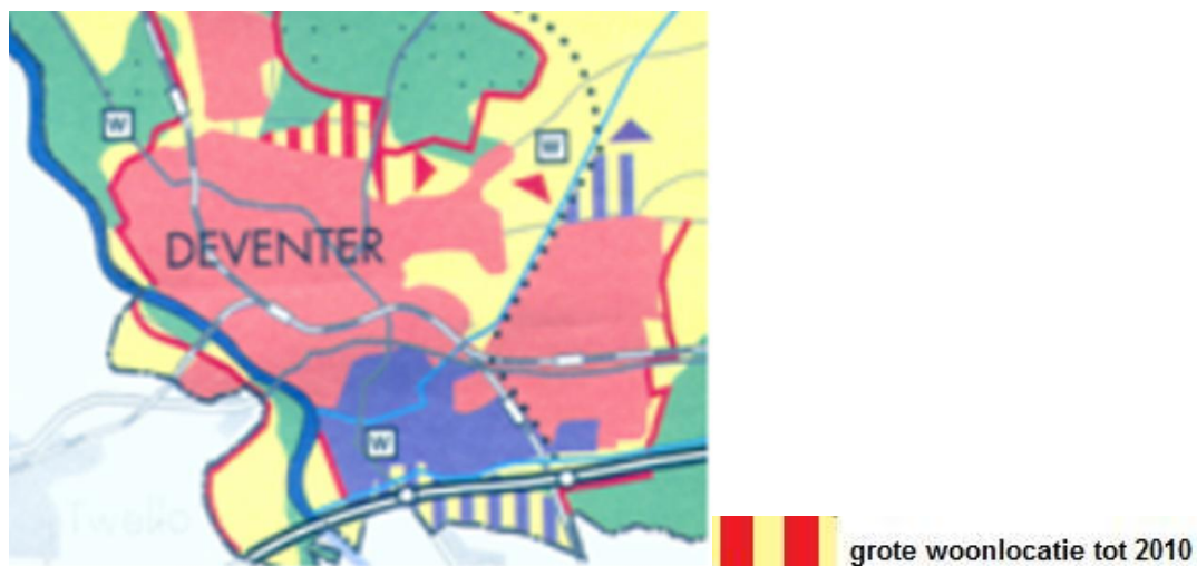
Steenbrugge in Streekplan

Het Streekplan is inmiddels vervallen en overgenomen door de Omgevingsvisie en de Omgevingsverordening. Op deze plannen wordt ingegaan in paragraaf 2.3.2 en 2.3.3.