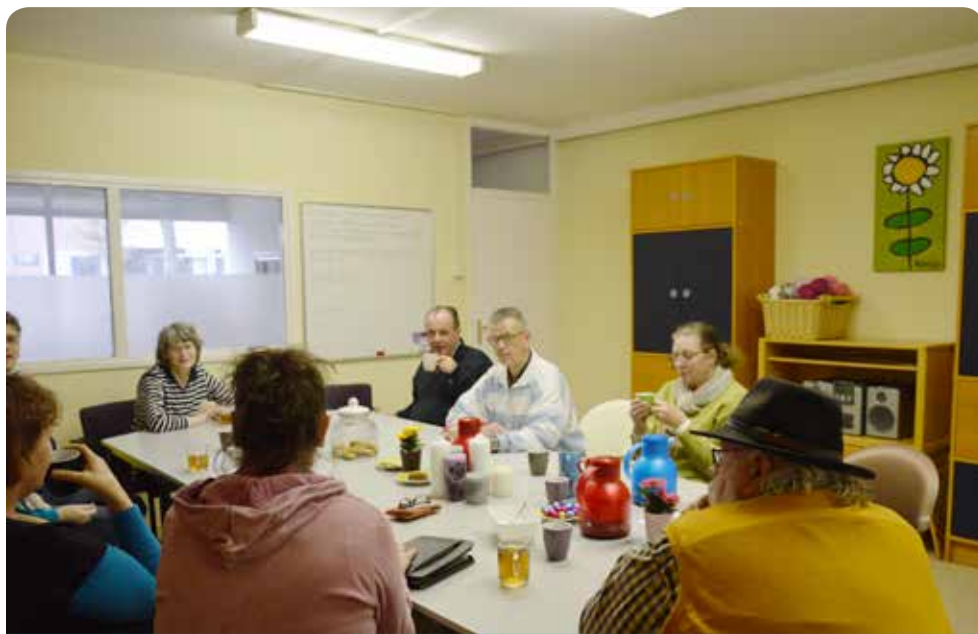
Gezellig bijpraten in Pandje 221

Het "Pandje 221" aan de Gildenburg 221 is een klein buurthuis in het Oostrik. Hier komen 50-plussers graag samen voor bijvoorbeeld yoga op woensdagochtend van 10 tot 12 uur of creatief bezig zijn op donderdagochtend ook van 10 tot 12 uur.